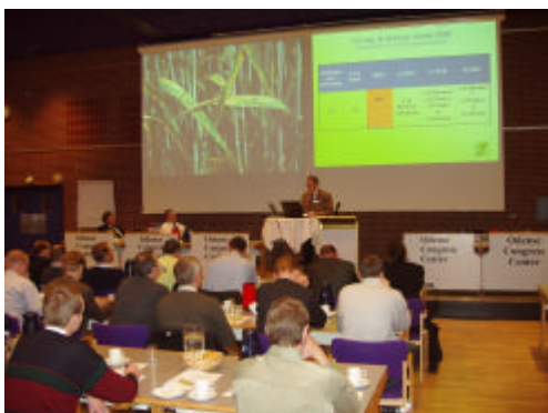
Indtryk fra Planteavlskonferencen den 7. februar 2006

Der må kun anvendes og besiddes godkendte plantebeskyttelsesmidler. En liste over disse kan ses på middeldatabasen på www.landbrugsinfo.dk .