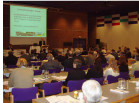
Indtryk fra Skatte- og lovdagen den 25. januar 2006

-620 kr. og -970 kr. pr. ha uden afkoblet EU-støtte.